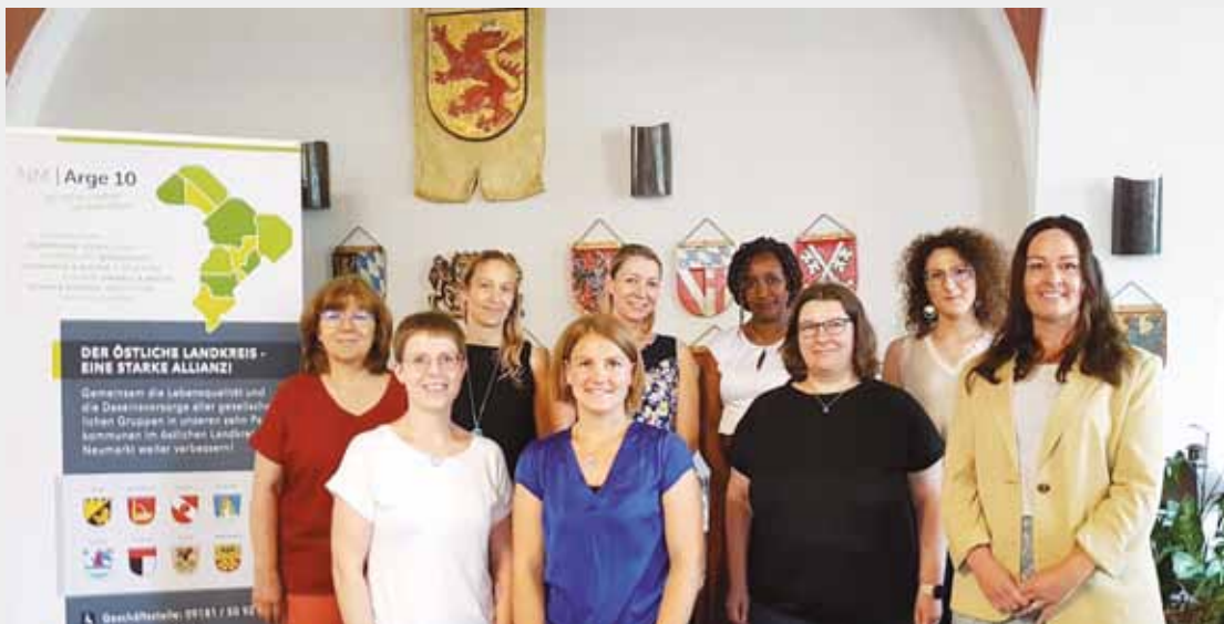
Kassenfachkräfte der ILE- Kommunen und die Umsetzungsbegleitung